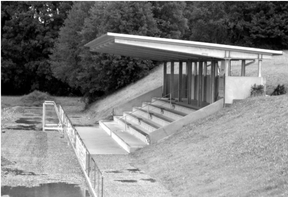
Tribüne als grünes Klassenzimmer

Die förderfähigen Kosten einer Mensa für ein Gymnasium wurden in Anlehnung an die Schulbauförderungsrichtlinien mit dem Kostenrichtwert von 2.520 €/m 2 , die Mensa für eine Grund- und Hauptschule dagegen mit 2.290 €/m 2 berechnet, obwohl es sich um bauart- und kostengleiche Baumaßnahmen handelte.